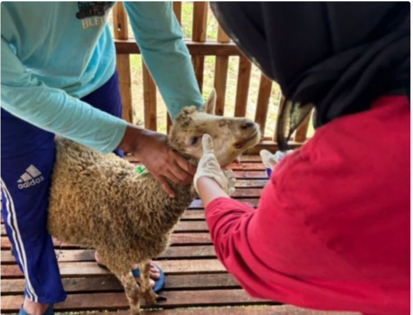
Perawatan Domba Lembaga Pemasyarakatan Terbuka kelas IIB Kendal.

Kendal - Lapas Terbuka Kendal berkomitmen untuk melaksanakan program ketahanan pangan. Bukan hanya di bidang pertanian dan perikanan, Lapas yang terletak di Kecamatan Patebon ini juga berinovasi di bidang peternakan yaitu bertenak Domba.