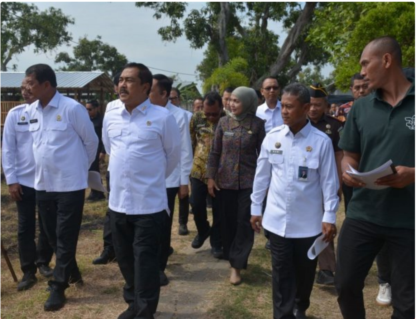
Menteri Imipas Kunjungi Lapas Terbuka Kendal, Tinjau Kegiatan Kemandirian WBP Dalam Mendukung Program Ketahanan Pangan

Kendal – Menteri Imigrasi dan Pemasyarakatan, Agus Andrianto melakukan