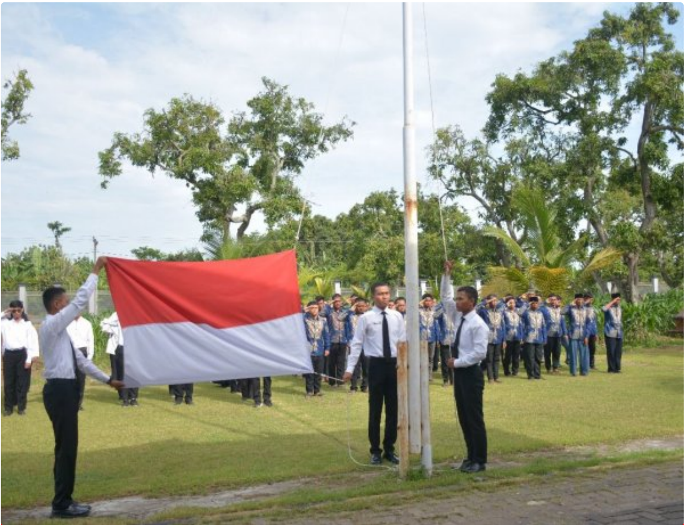
Lapas Terbuka Kendal Gelar Upacara Peringatan HUT KORPRI Ke-54

Kendal– Lapas Terbuka Kendal hari ini menyelenggarakan Upacara Peringatan Hari Ulang Tahun (HUT) Korps Pegawai Republik Indonesia (KORPRI) ke-54 Tahun 2025 di lingkungan Lapas, Senin (01/12/2025).