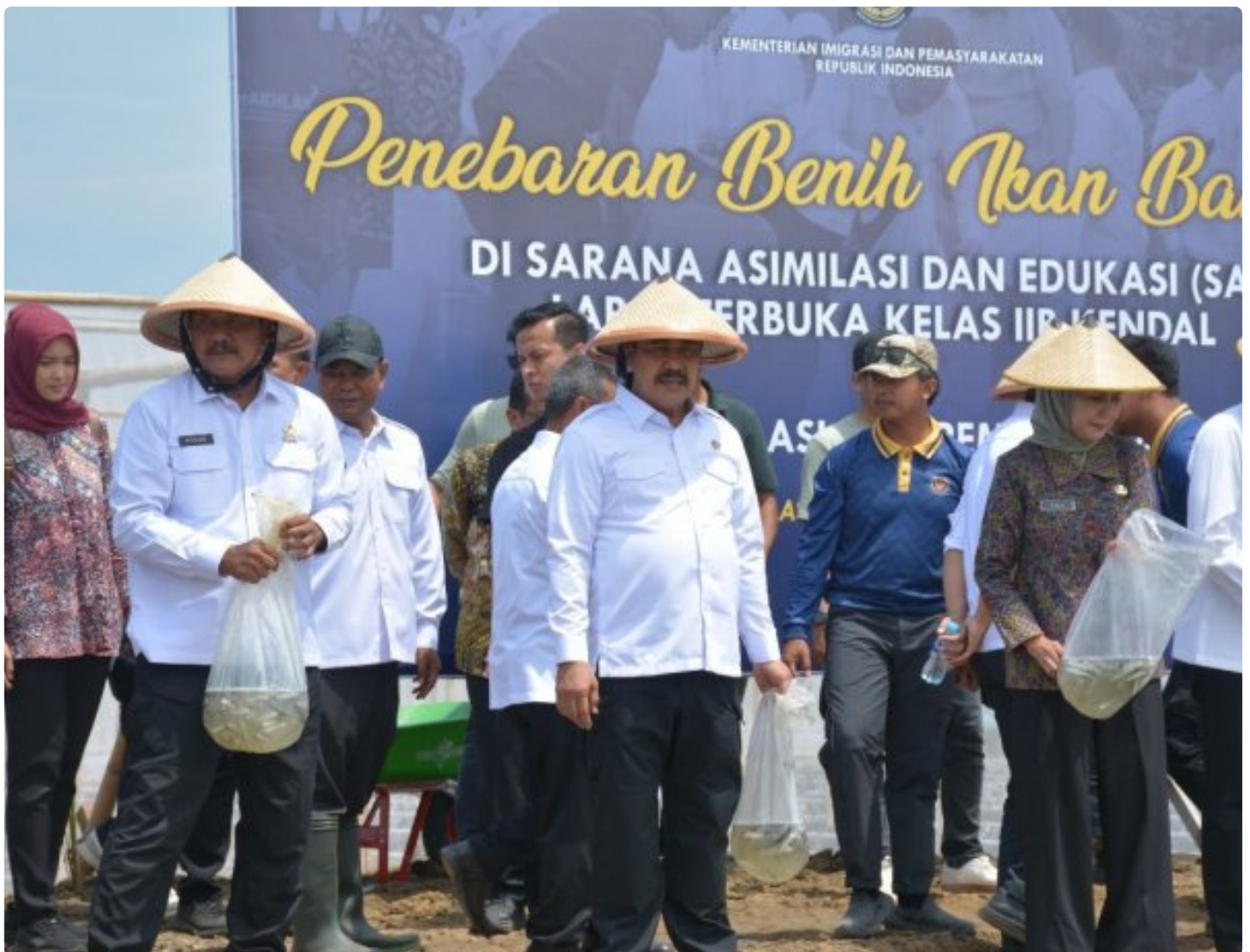
Budidaya Ikan Bandeng Lapas Terbuka Kendal, ubah Lahan Idle jadi Produktif

Kendal – Lapas Terbuka Kendal berkomitmen untuk melaksanakan program ketahanan pangan secara serius. Tidak hanya dalam bidang pertanian, Lapas yang terletak di Kecamatan Patebon Kendal ini berinovasi di bidang perikanan dengan membudidayakan ikan bandeng.